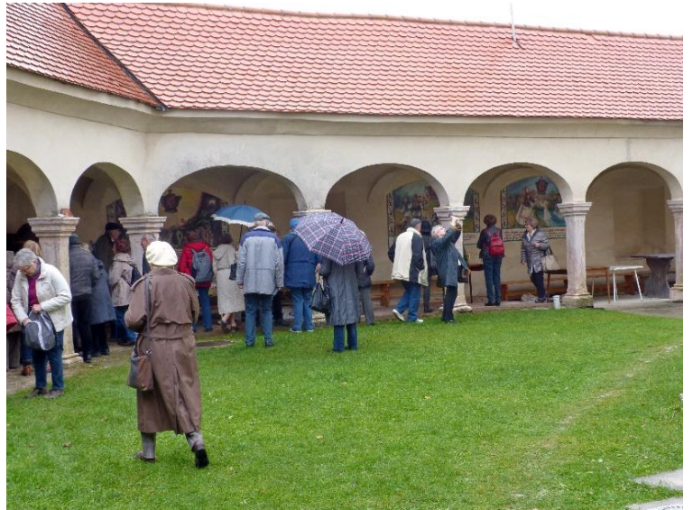
Crkva sa cinktorom