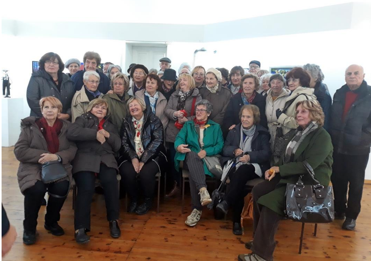
Skupna fotografija u Galeriji izvorne umjetnosti Zlatar