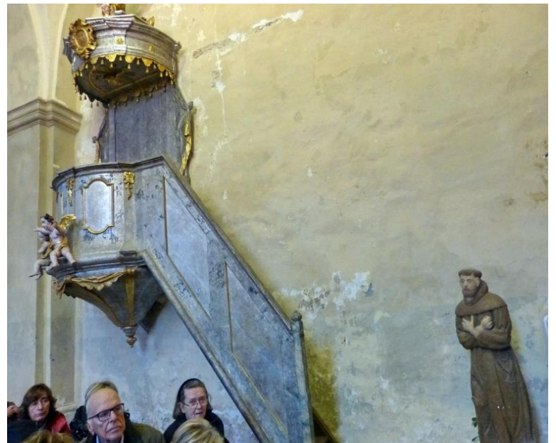
Glavni oltar i propovjedaonica