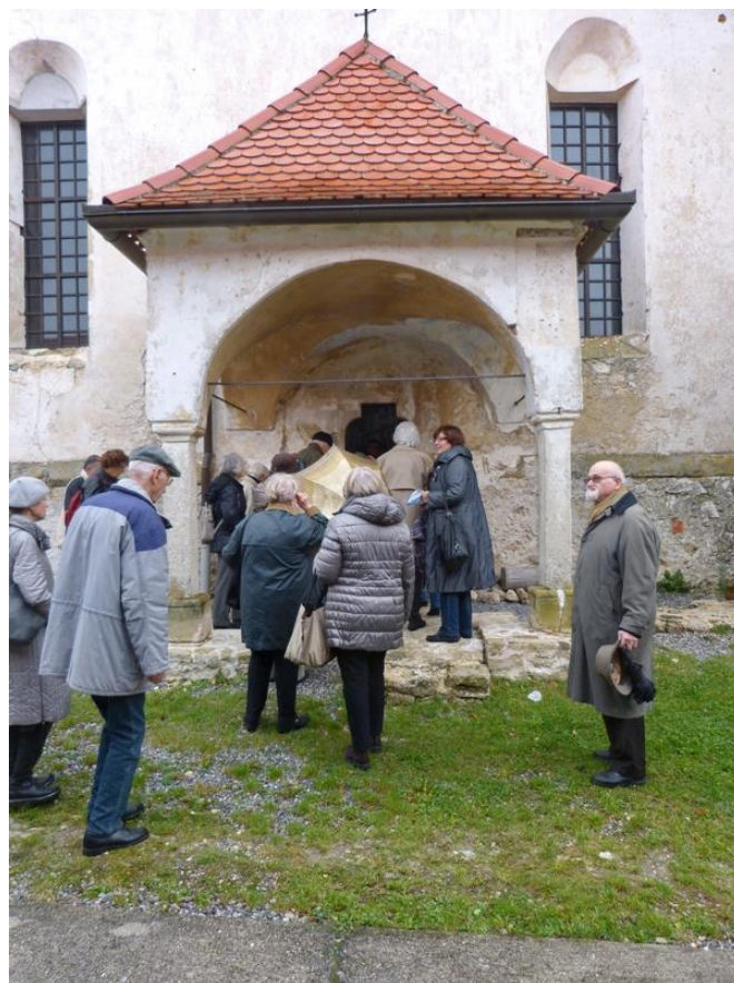
Ulaz u crkvu