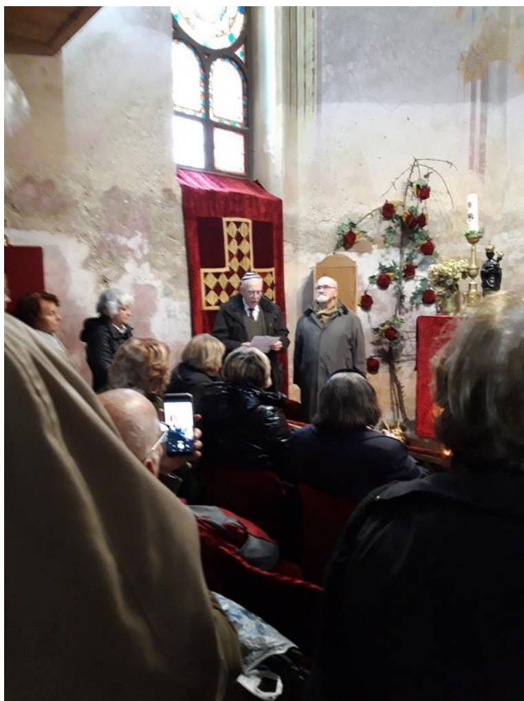
Fotografije iz kapelice