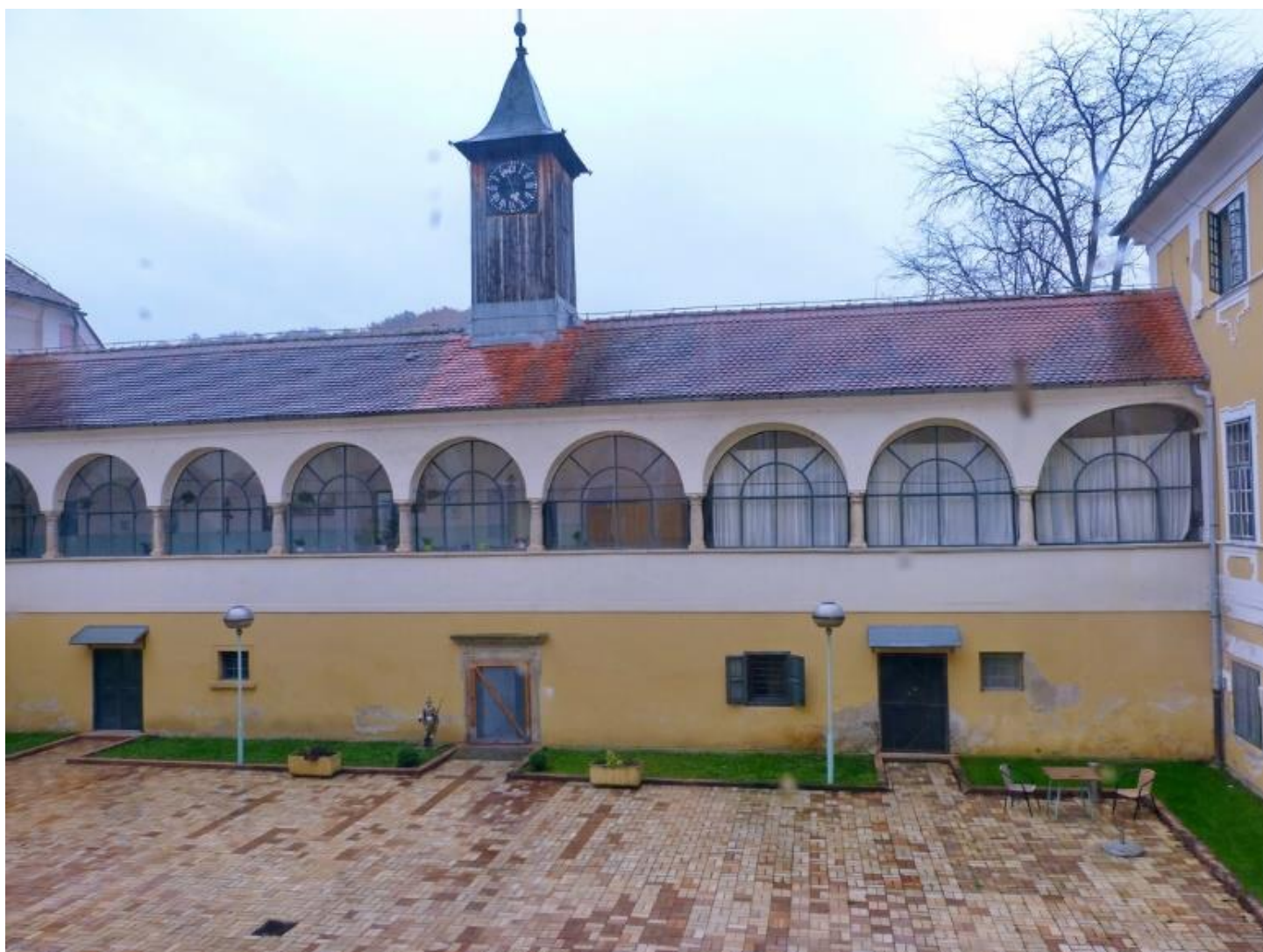
Kapelica u dvorcu