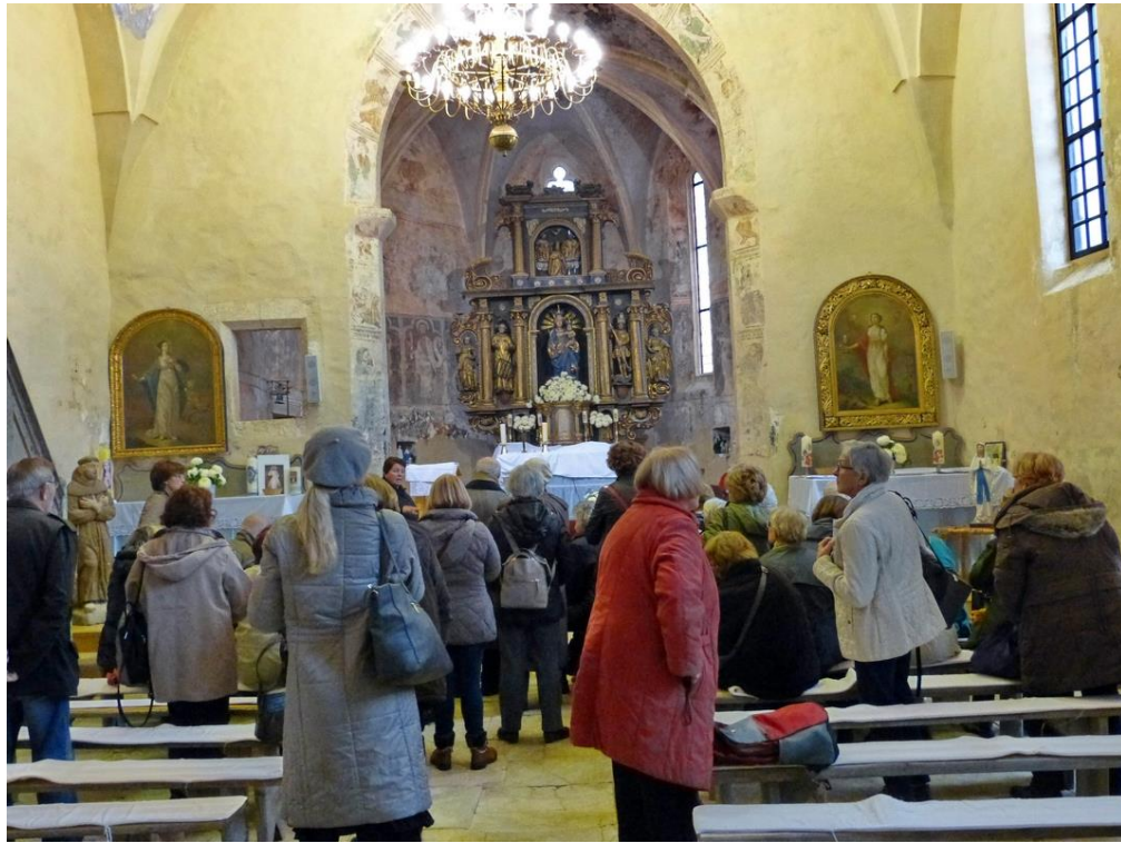
Unutrašnjost crkve MBG