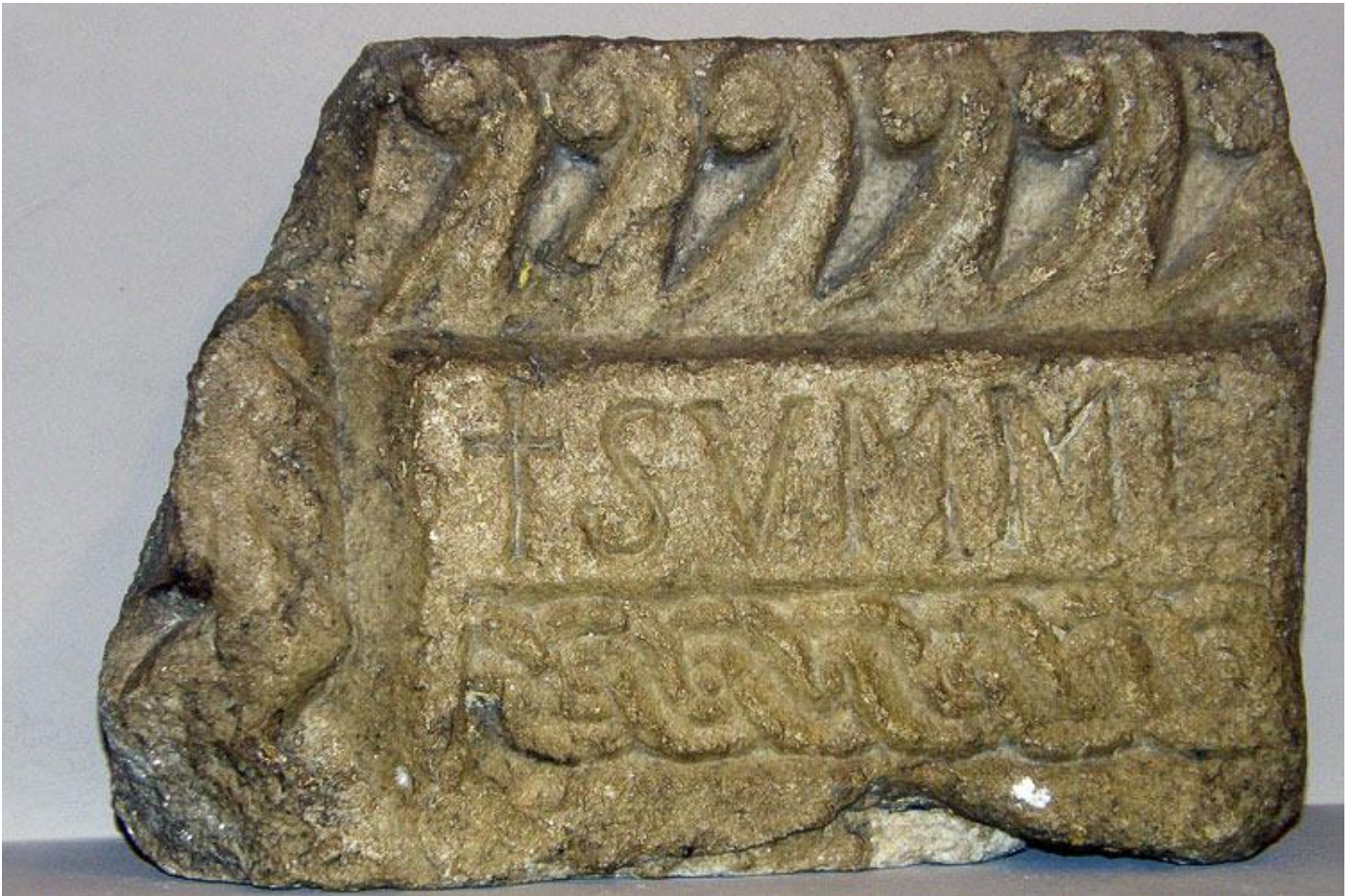
Starohrvatski pleter iz 1076. godine, s natpisom +SVMME, pronađen je 1946. godine. Dio pletera ugrađen je ispod propovjedaonice, dok se drugi dio nalazi u Arheološkom muzeju u Zagrebu.