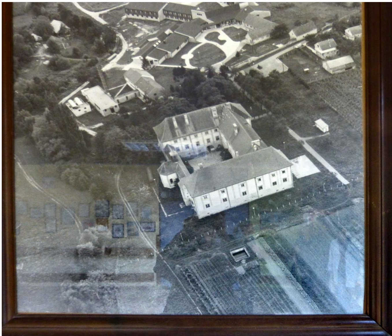
Fotografija dvorca iz zraka (slika u hodniku dvorca)