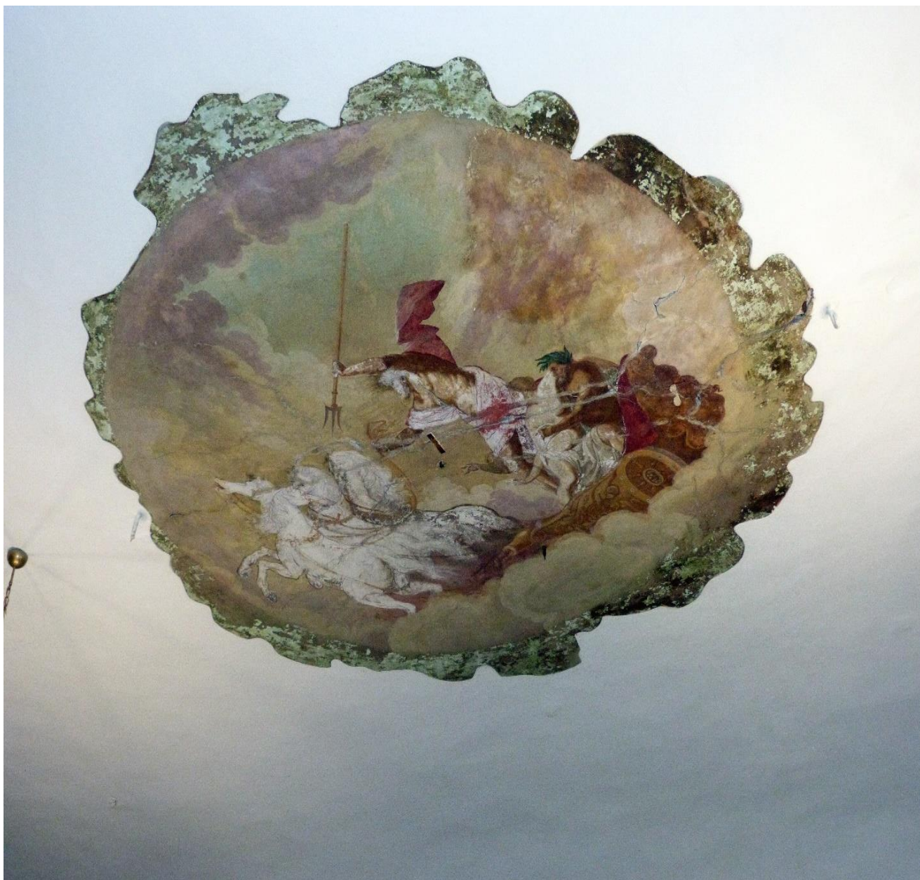
Na stropu je dvorane bila zanimljiva freska.